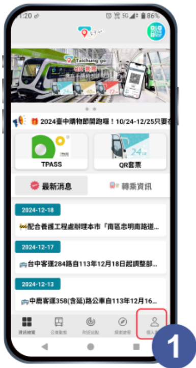
開啟台中Go APP 點選【個人專區】