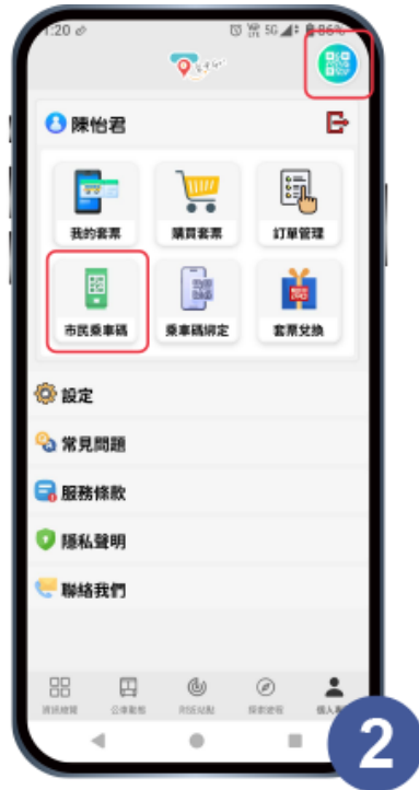
點選【市民乘車碼】 或右上角浮動球